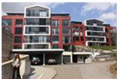
Obere Dorfstrasse Amden