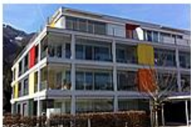
Zigeribi 2 Oberurnen