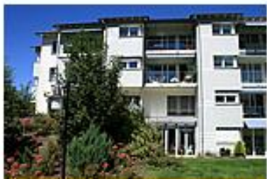
Letz 17, Näfels