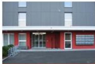
Letz 18, Näfels