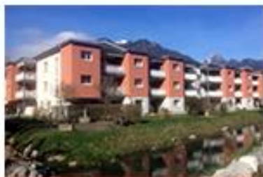
Farbwiesstr. 15 Niederurnen