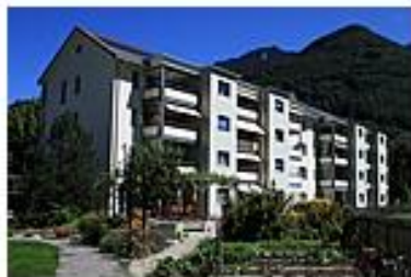
Letz 19, Näfels