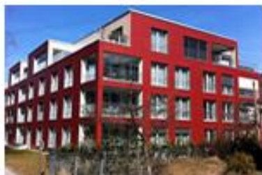
Denkmalweg 14 Näfels