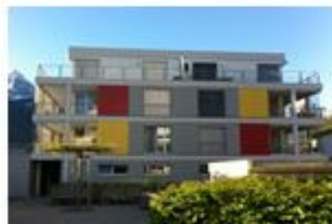
Zigeribi 4 Oberurnen